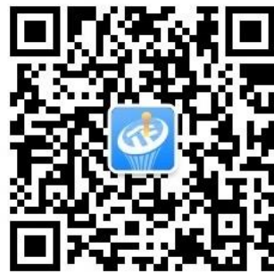
光谷企业服务公众号

东湖高新区企业服务中心通过专业化、市场化、立体化的企业服务，打造光谷企业服务品牌，为高新区的经济繁荣贡献力量。